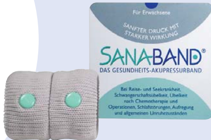
ERWACHSENE: Farbe grau KINDER: Farben rot und blau